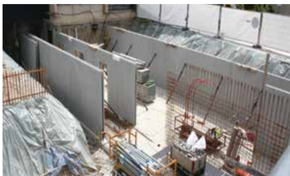
Les futurs ateliers

Entre 2006 et 2008, d'importants travaux de mise en conformité de la sécurité incendie et de la cuisine sont entrepris dans le premier bâtiment.