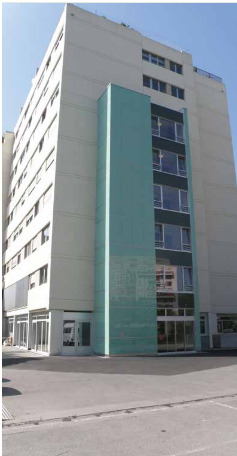
Après travaux, le rez accueille entre autres le restaurant

Et il a encore quelques projets dans ses cartons, pour les mois et années à venir !