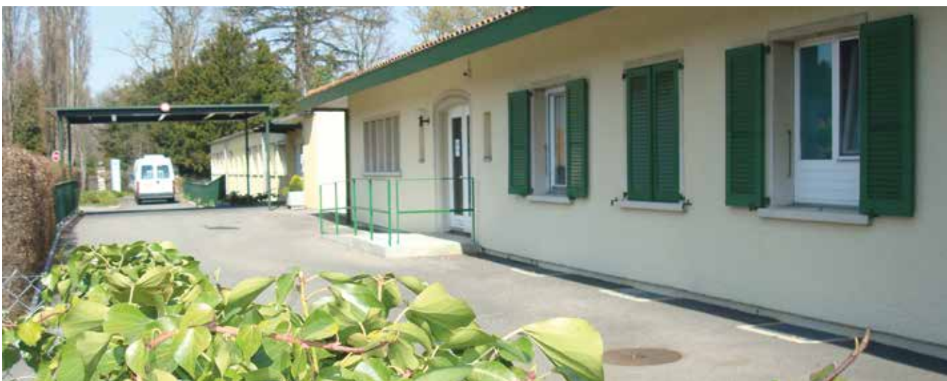
L'ancien bâtiment et son extension