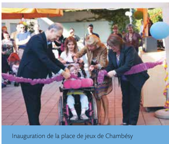
Inauguration de la place de jeux de Chambésy

Ce foyer a grandi ces quinze dernières années pour accueillir des nouveaux résidents, des personnes à la journée au centre de jour et des jeunes en formation ou des employés en poste de travail adapté. Il est donc évident que la cuisine, la buanderie et les locaux d'entretien ne répondent plus aux normes et aux besoins du foyer.