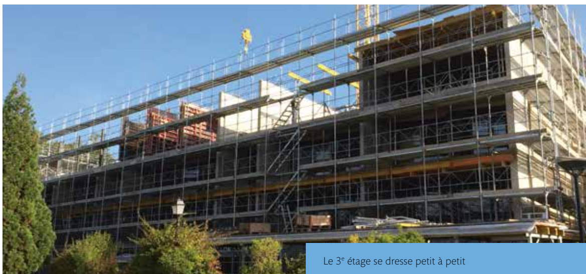
Le 3 e étage se dresse petit à petit

Ce projet de rénovation et de surélévation est un formidable cadeau pour ses 40 ans, une formidable chance pour les personnes en situation de handicap et pour tout le personnel engagé, qui depuis des années, jour après jour, ont écrit l'Histoire de notre école et foyer et de ce fait celle de la Fondation Clair Bois !