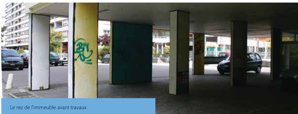
Le rez de l'immeuble avant travaux

Le projet initial demeure identique. Il est soutenu par une équipe pluridisciplinaire engagée et vise à toujours porter son action pratique vers de nouvelles perspectives. Il se concentre sur des projets culturels, collectifs et intégratifs, ainsi que sur le bien-être des usagers et bénéficiaires.