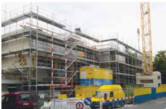
2014: un chantier

Durant les années 1998-1999, la mise en place, pour chaque élève, d'un projet personnalisé, devient la règle. L'action pluridisciplinaire au bénéfice des enfants s'inscrit dans ce cadre de pensées et d'actions. Plus de quinze classes-ateliers proposent aux enfants des activités variées et stimulantes.