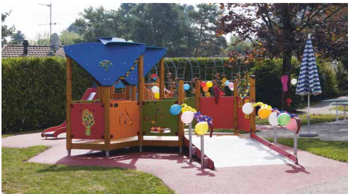
La nouvelle place de jeux

Une école spéciale, spécialement conviviale, spécialement chaleureuse, spécialement dynamique est née. C'est en 2005 que nous inaugurons, en grande pompe, ce nouvel endroit.